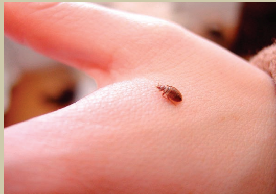
Este es un chinche adulto nutriéndose en piel humana . Sus mordidas pueden dejar marcas notables en algunas personas mientras que en otras no dejen ningunas.