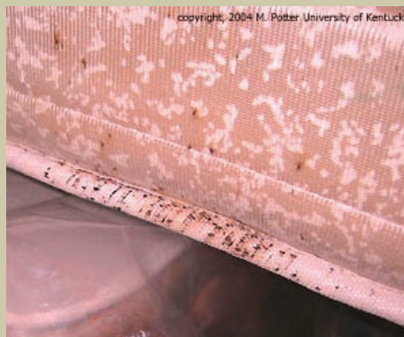
Este colchón muestra señales de manchas de sangre y excremento de chinches.

• Para infestaciones menos severas, protectores de colchón (disponibles en tiendas para ropa de cama o alergias) deben ser utilizados para evitar el acceso a los chinches.